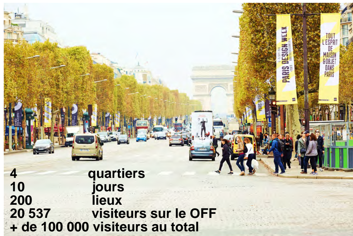
PDW 2018 Champs-Élysées 009