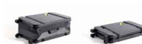
Valise AIR FORCE