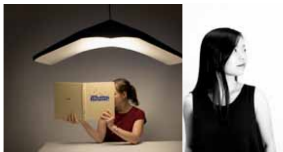
Luminaire acoustique NUÉE