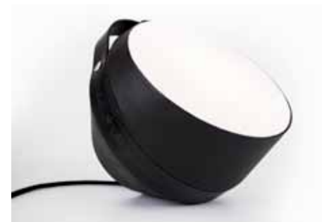
Lampe à poser FARO

Chêne massif tourné traité à l'oxyde métallique – poignée en cuir gravé et découpé au laser – abat-jour réalisé à la main en agneau nappa noir mat – diffusant en feutrine M1 – enrouleur de câble en acier époxy noir fine texture – câble en coton filé noir mat – variateur LED & ampoule LED r7s