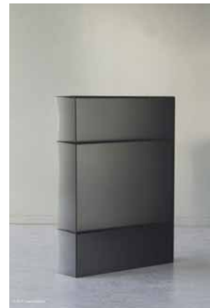
Etagère « The one liquid plastic » de Julien Manaira, lauréat du RADO STAR PRIZE 2017 - Prix du Jury

Dans ce procédé, la résine Epoxy rend possible une approche plus directe du matériau plastique. La pigmentation du matériau permet de rendre compte des mouvements de la matière pour aboutir à l'objet. La pigmentation rend aussi compte de l'épaisseur de l'objet, directement liée au processus de fabrication et dépendant des choix et gestes exécutés par l'opérateur.