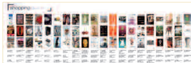
shopping quartiers shopping quarters