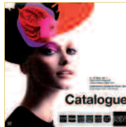
shopping collection / collection shopping

= 1,500 € excl. VAT instead of 2,300 € excl. VAT